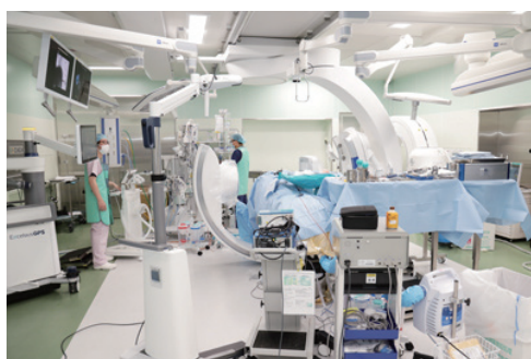
ハイブリッド手術室