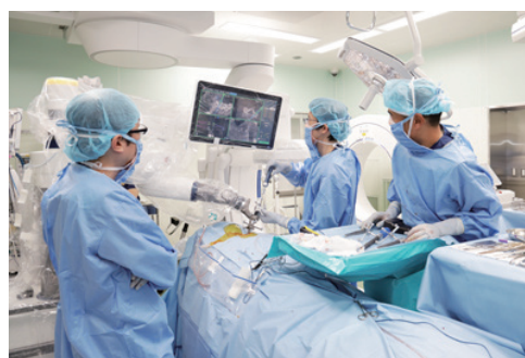
脊椎ロボット手術

判断に迷う症例、手術を迷っておられる方など症状に寄り添いながら検査等も行いますので、まずはお気軽にご相談ください